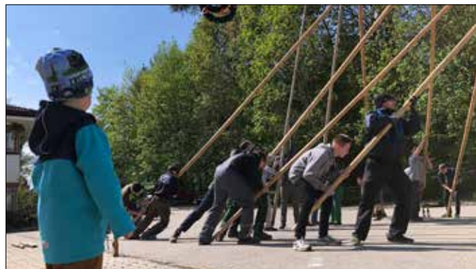
Am 28. April wird beim Bezirksseniorenwohnheim mit vereinten Kräften wieder ein Maibaum aufgestellt.

Wir sind schon mitten in den Planungen für unser großes