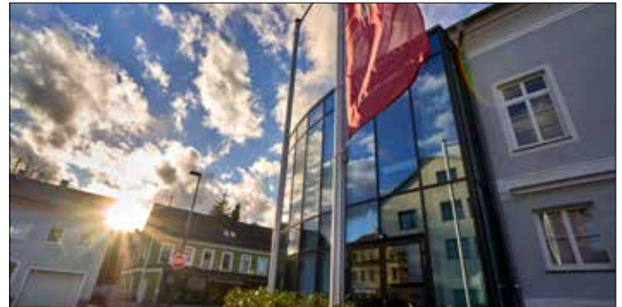
Beim Theater spiegelt nicht nur die Fassade, sondern seit kurzem ein neuer Verkehrsspiegel.

Milde Winter halten im Allgemeinen auch die Kosten für Ausbesserungsarbeiten von Straßenschäden im geregelten Rahmen. Seitens des Infrastrukturausschusses und des Stadtamtes Bad Hall wissen wir über die Zustände unseres Straßennetzes Bescheid und haben bereits im Vorjahr wieder einen Fahrplan für die Sanierungen 2023 erstellt. Wohl wissend, dass Ihnen als Bürger und Bürgerin Ihre Straße die nahestehendste ist, ersuche ich aber auch