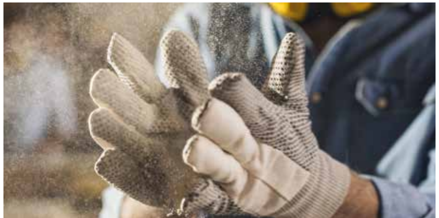
Arbeit bildet in unserem Land den Stützpfeiler für soziale Netze.

„Als OÖVP verfolgen wir ein klares Ziel: Oberösterreich muss auch in Zeiten von hohen Energiepreisen und Klimaschutz ein Land der Arbeit und Produktion bleiben. Daher lauten unsere Leitlinien in diesem Jahr: Helfen, wo Hilfe benötigt wird, und investieren, wo sich die Zukunft des Landes entscheidet “, betont Landeshauptmann Thomas Stelzer. So wolle man für die Menschen und Betriebe den Umbruch zu einem Aufbruch machen.