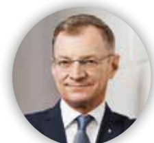
Thomas Stelzer Landeshauptmann

„ Oberösterreich muss auch in Zeiten von hohen Energiepreisen und Klimaschutz ein Land der Arbeit und Produktion bleiben. “