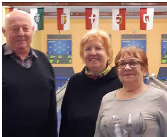
Aktiver Vorstand. Aktive Kegler:innen.